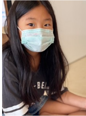
Gia sư tại nhà