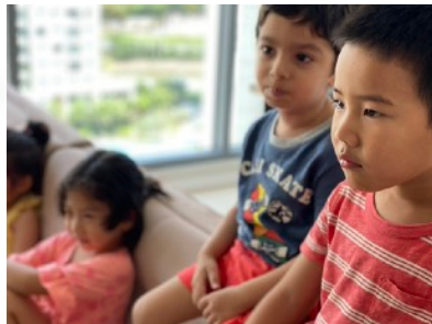
Tiếng Anh Mẫu giáo