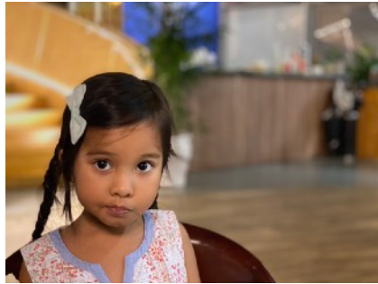
Tiếng Anh Mẫu giáo