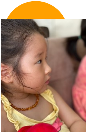
Tiếng Anh Chủ nhật