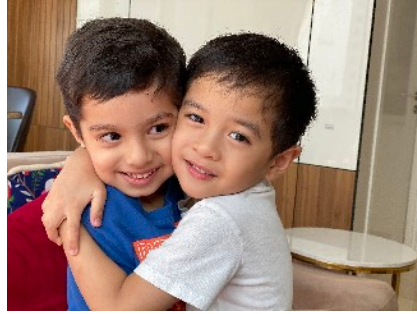
Tiếng Anh Mầm non