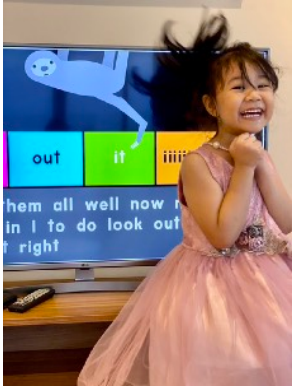
Tiếng Anh thứ Ba & Thứ Năm