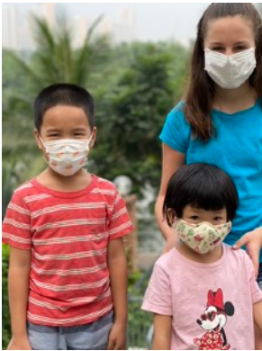
Một vài thành viên của lớp Tiếng Anh Thứ Bảy