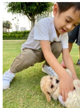
Gia sư tại nhà