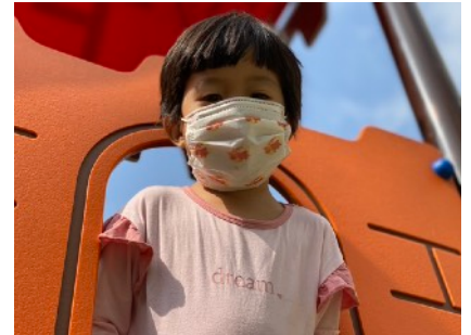
Tiếng Anh Cuối tuần