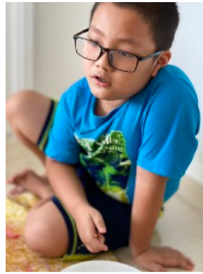
Ngoại khóa thứ Bảy